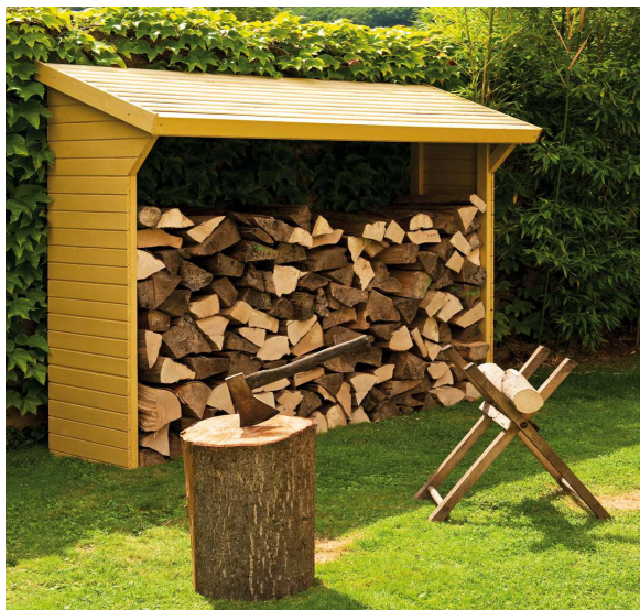
modèle vendu non peint - model sold unpainted