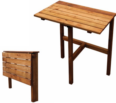
Table pliante ADAPT